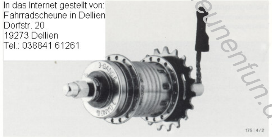
175 : 4 / 2